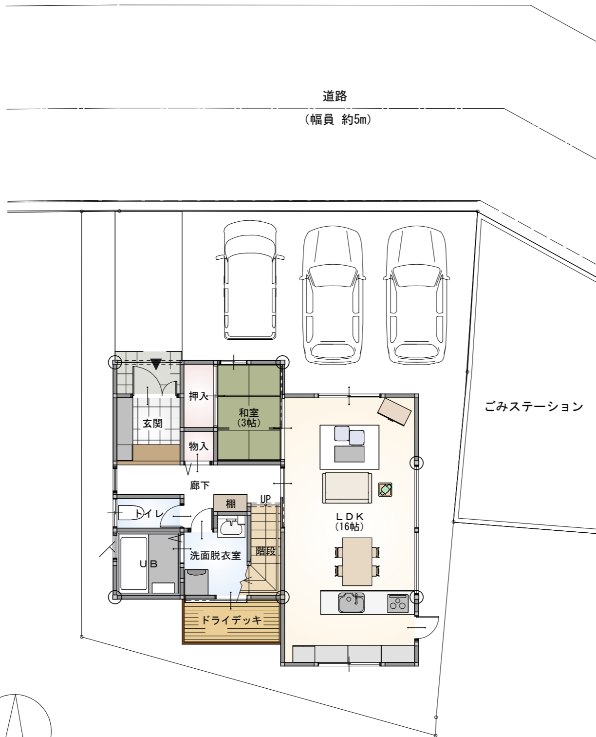
1階 平面図 S:1/100